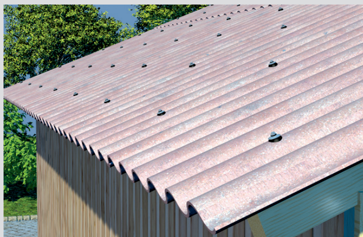
Vlakno-cementni vijak FAFZ H